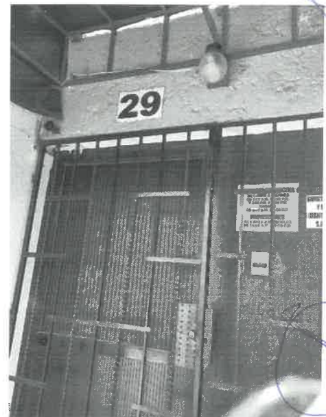
ACCESO A LA ADMINISTRACION DE LA PLAZA COMERCIAL ----- PASA AL FOLIO NÚMERO CUATRO -----